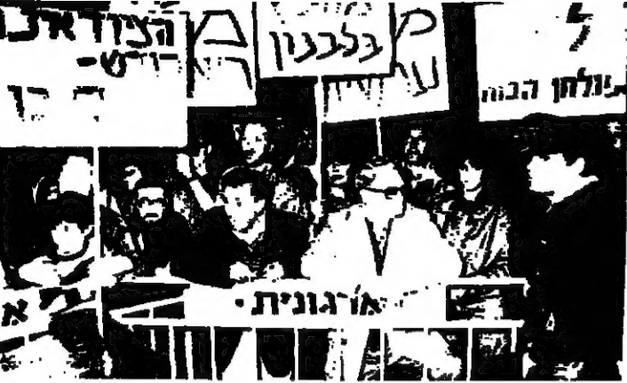
انضم تنظيم اسرائيلي في تل ابيب لطلب بالانسحاب من لبنان (١٠ - رايو)